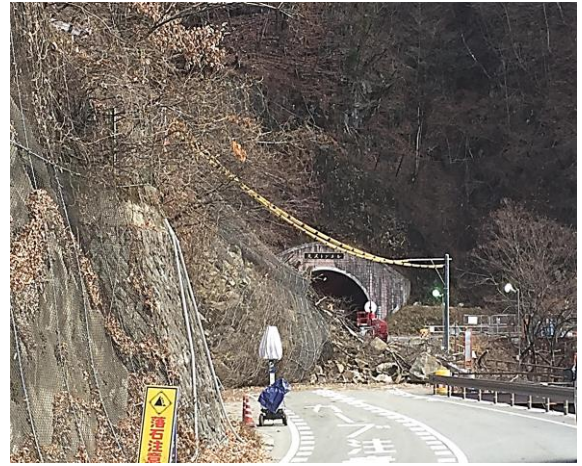
リニア関連工事で崩落事故（長野県中川村）

③長野県の発生土置き場について。参加人の主張によれば、長野県内には大鹿村に3カ所の仮置き場と、大鹿村旧荒川荘跡地への発生土置き場、及び、豊丘村