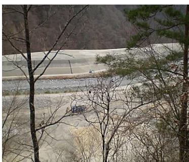
中川村では河岸にリニア道路工事残土積み置き場