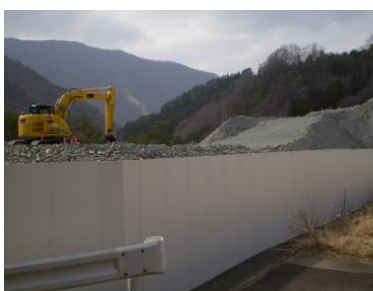
大鹿村では村内にリニア残土置き場